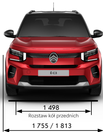
Szerokość z lusterkami złożonymi / rozłożonymi