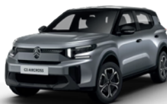
PERLA NERA BLACK z lakierem MERCURY GREY