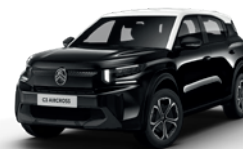
OPAL WHITE z lakierem PERLA NERA BLACK