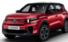
PERLA NERA BLACK z lakierem ELIXIR RED