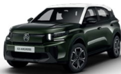
OPAL WHITE z lakierem MONTANA GREEN