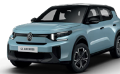
PERLA NERA BLACK z lakierem BLEU MONTE CARLO

● - Standard - - nie występuje P - pakiet opcji