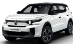
PERLA NERA BLACK z lakierem POLAR WHITE