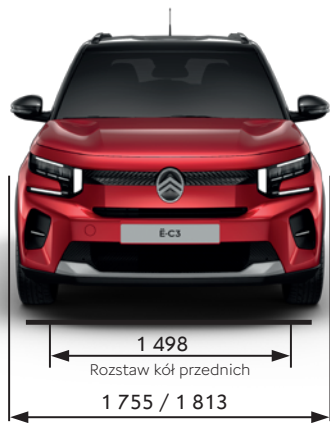
Szerokość z lusterkami złożonymi / rozłożonymi