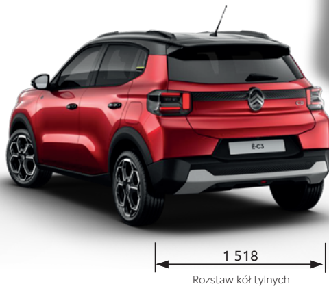
Rozstaw kół tylnych